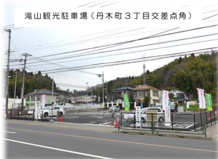
滝山観光駐車場（丹木町3丁目交差点角）