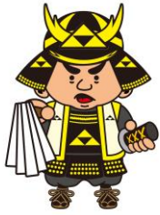
滝山城主 北条氏照