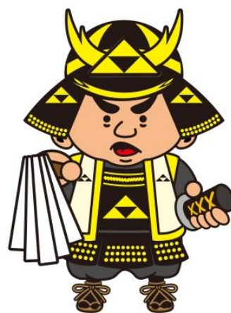
滝山城主 北条氏照