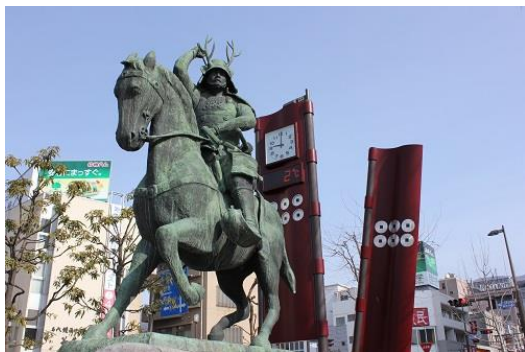
真田信繁騎馬像

・秀吉の小田原攻めの戦場で人身売買 ・朝鮮半島の戦場で人取り ・関ヶ原の戦いで人取りに夢中になる徳川軍と石田三成軍の兵士 ・大坂の陣で敵も味方も人取りに没頭する戦場