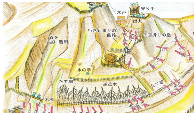
『滝山城戦国絵図』NPO法人滝山城跡群・自然と歴史を守る会 より)